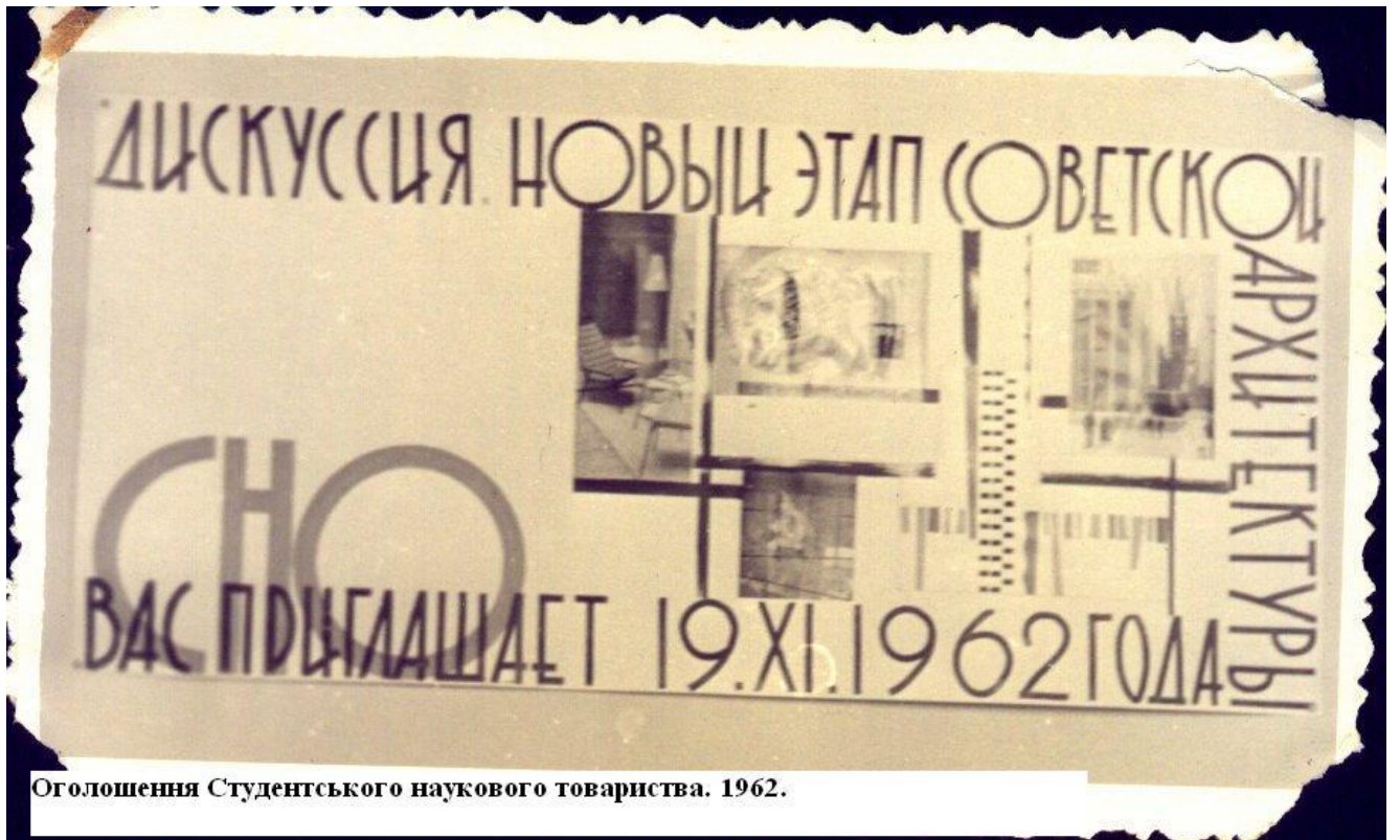
Оголошення Студентського наукового товариства. 1962.